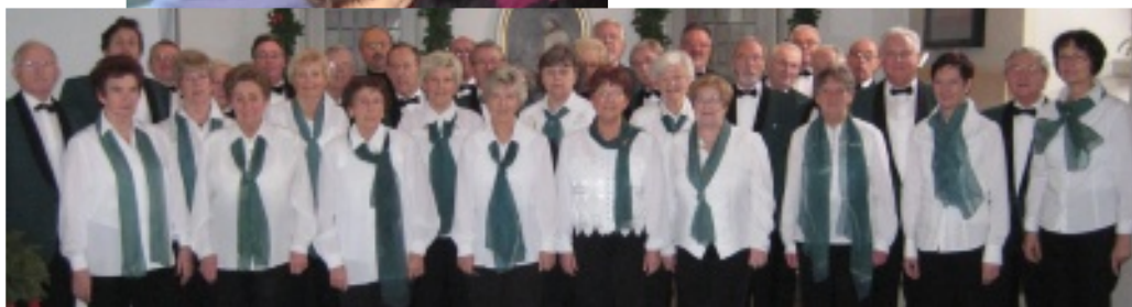
Gottesdienst am 4. Advent: Lindener Chöre