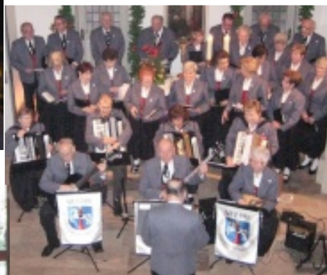
Gottesdienst am 3. Advent: Folkloregruppe des Freizeitvereins Wolfenbüttel