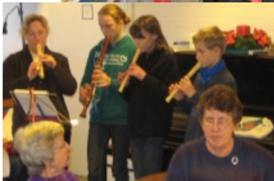
Adventsfeier von Frauenhilfe und Seniorenkreis