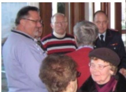
Sektempfang nach Epiphaniis-Gottesdienst