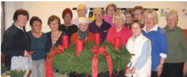
Frauenbastelkreis mit dem selbst hergestellten Adventskranz